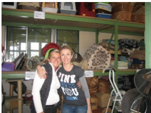
Im Lager von Susy Utzinger

Am 5. April wurde der Bus von uns und freiwilligen Helfern mit all den gesammelten Materialspenden beladen. Wir konnten dank Ihnen und der Suzi Utzinger Stiftung den Transporter randvoll beladen.