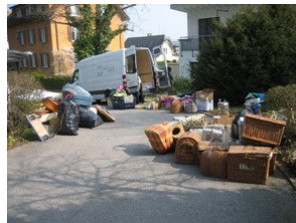
Unser Transporter kurz vor der Abfahrt