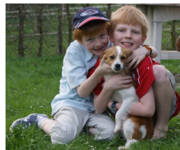
Bella, die Traumfamilienhündin