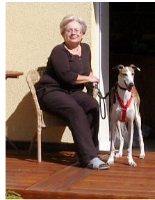
Flash endlich angekommen