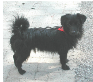
Unser süsser Perdigone