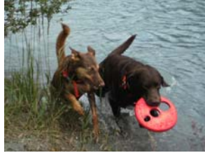
Choquise mit Joy voller Lebensfreude