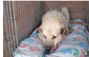
Bibi zufrieden in seiner Transportbox