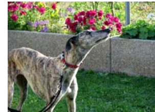
Buleria genießt ihren Garten

Die Bilder sprechen für sich und wir sind mehr als zufrieden und dies dank Ihnen allen: unseren Spendern, Mithelfer/innen, Fahrer, Tierheimmitarbeiter/innen und zuletzt den Leuten, welche einem spanischen Hund eine Chance geben.