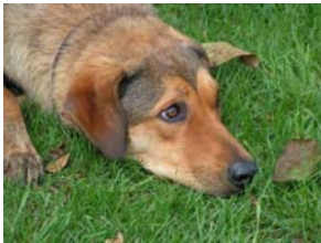
Chispa findet ihre verdiente Ruhe