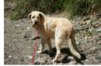
Bibi lebt jetzt im Jura