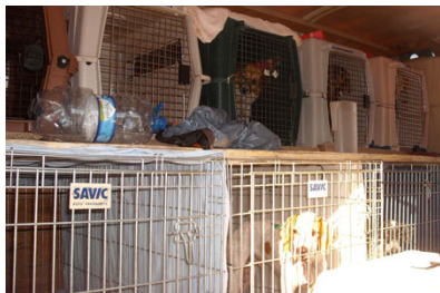
Neugierige Blicke: Beladener Transporter

Seit dem letzten Newsletter vor vier Monaten können wir wieder auf eine erfolgreiche Rettungsaktion aus Spanien zurück blicken. Mit Freude können wir berichten, dass zwei Kleinbusse mit insgesamt 26 Hunden in die Schweiz gefahren wurden. Es war eine sehr lange Fahrt, welche die Hunde erdulden mussten. Als sie aber von Ihren neuen Familien in Empfang genommen wurden, war der Stress wohl bald vergessen. Wir danken den Fahrern, den neuen Hundebesitzern, welche unseren Schützlingen ein neues Zuhause bieten und geduldig auf die Ankunft ihrer Vierbeiner gewartet haben und wir danken allen Helfer/innen, welche uns immer wieder tatkräftig zur Seite stehen.