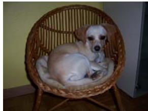
Mira hat ein eigenes Sofa