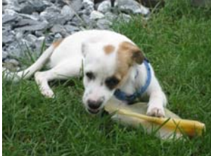
Rocky in seinem neuen Paradies

Aber alle haben sie eines gemeinsam, sie lernen sehr schnell und wenn sie sich erst einmal eingelebt haben, werden sie ewig für ihre Rettung und Befreiung dankbar sein!!!!!!