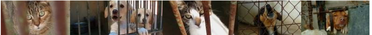
Ein wohltätiger Verein für Tiere in Not