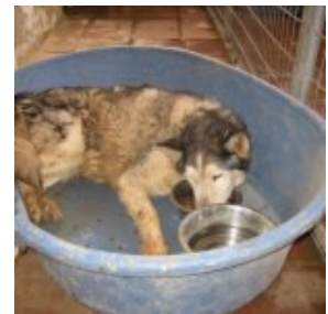
Snowflake's letzter Tag